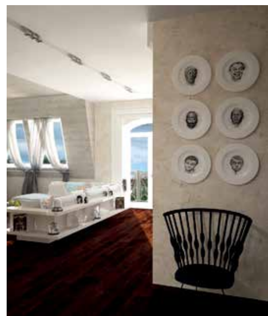
Гардеробная зона на первом этаже.