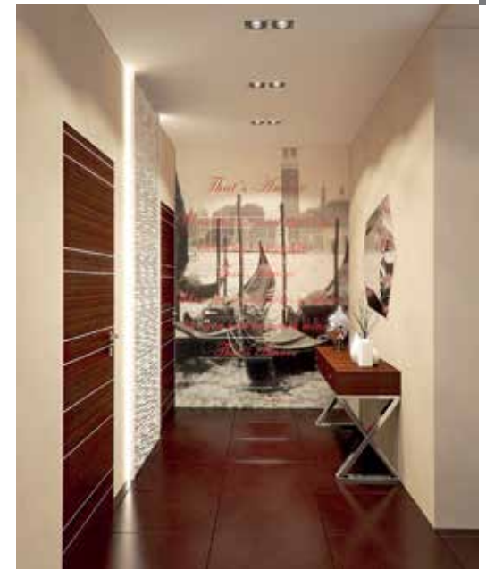
Холл. Панно с изображением Венеции визуально скрывает дверь санузел.